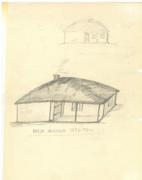
Рис. 5. Рисунок Н.И. Зотова, изображающий дом его семьи в станице Убеженской в 1930–1933 гг. Рисунок сделан по памяти в 1990 г.

Текст воспоминаний публикуется в соответствии с современными нормами орфографии и пунктуации. В квадратных скобках приведены недостающие слова.