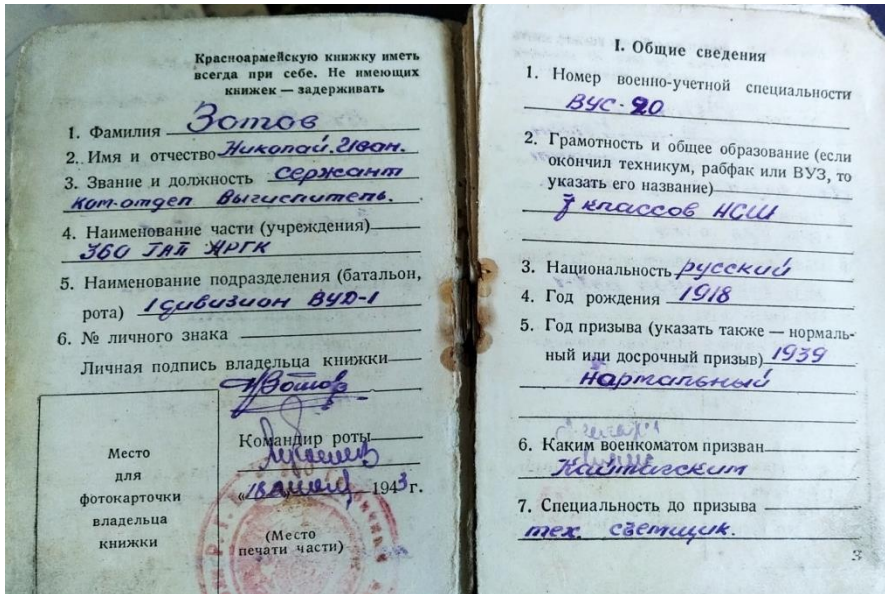
Рис. 1. Красноармейская книжка Н.И. Зотова.

Отечественной войны. Служил в 1-м дивизионе, во взводе управления дивизионом (ВУД) 360-го гаубичного артиллерийского полка Артиллерийского резерва Главного командования (АРГК) 1 .