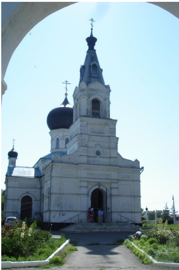
Рис. 2. Современное состояние Вознесенской церкви хутора Сусат. 2012 г.