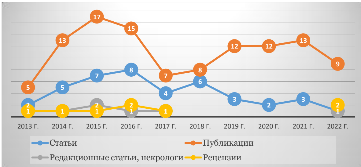
Рис. 1. Публикации в журнале «Русский архив» в 2013–2022 гг. (по годам)

Большинство материалов, примерно две третьих – 111 из 167, – как и подобает историко-архивному журналу, составляют публикации источников. Примерно четверть материалов составили аналитические статьи и сообщения. Чуть более 4 % – статьи в колонке главного редактора и около 5 % – рецензии на другие документальные публикации. Пик публикаций пришелся на 2014–2016 гг., когда журнал выходил ежеквартально. С 2016 г. в связи с переходом на выпуск по полугодиям последовало соответствующее сокращение общего количества публикаций.