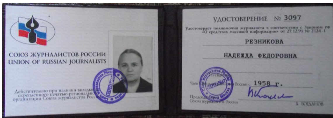
Фото 4. Удостоверение члена Союза журналистов России