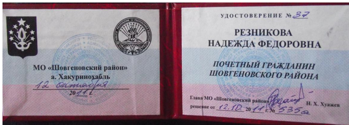
Фото 5. Удостоверение Почетного гражданина Шовгеновского района