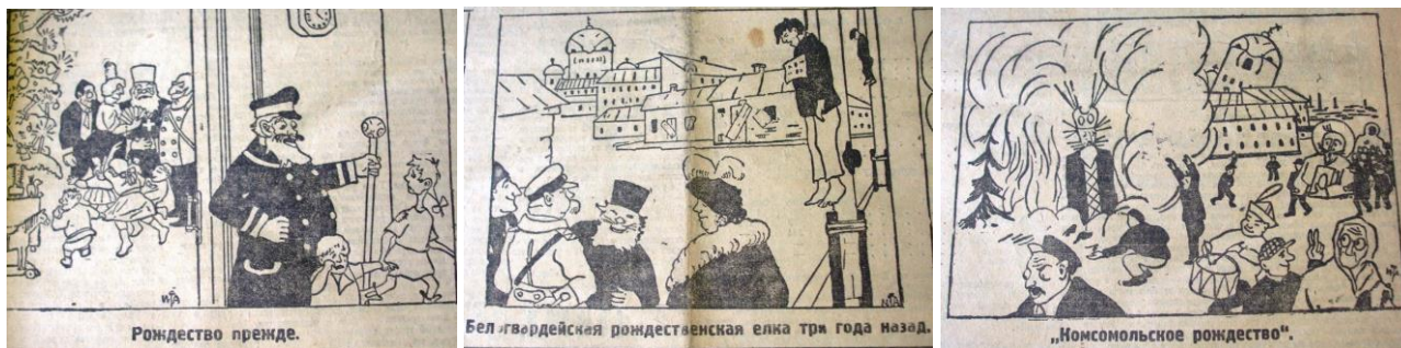
Рис. 1–3. Эволюция рождественского праздника: Рождество прежде. Белогвардейская рождественская елка три года назад. Комсомольское рождество. Трудовой Дон. 7 января 1923 г.

К «Комсомольскому Рождеству» // Советский Юг. 1923. 6 января. С. 3.