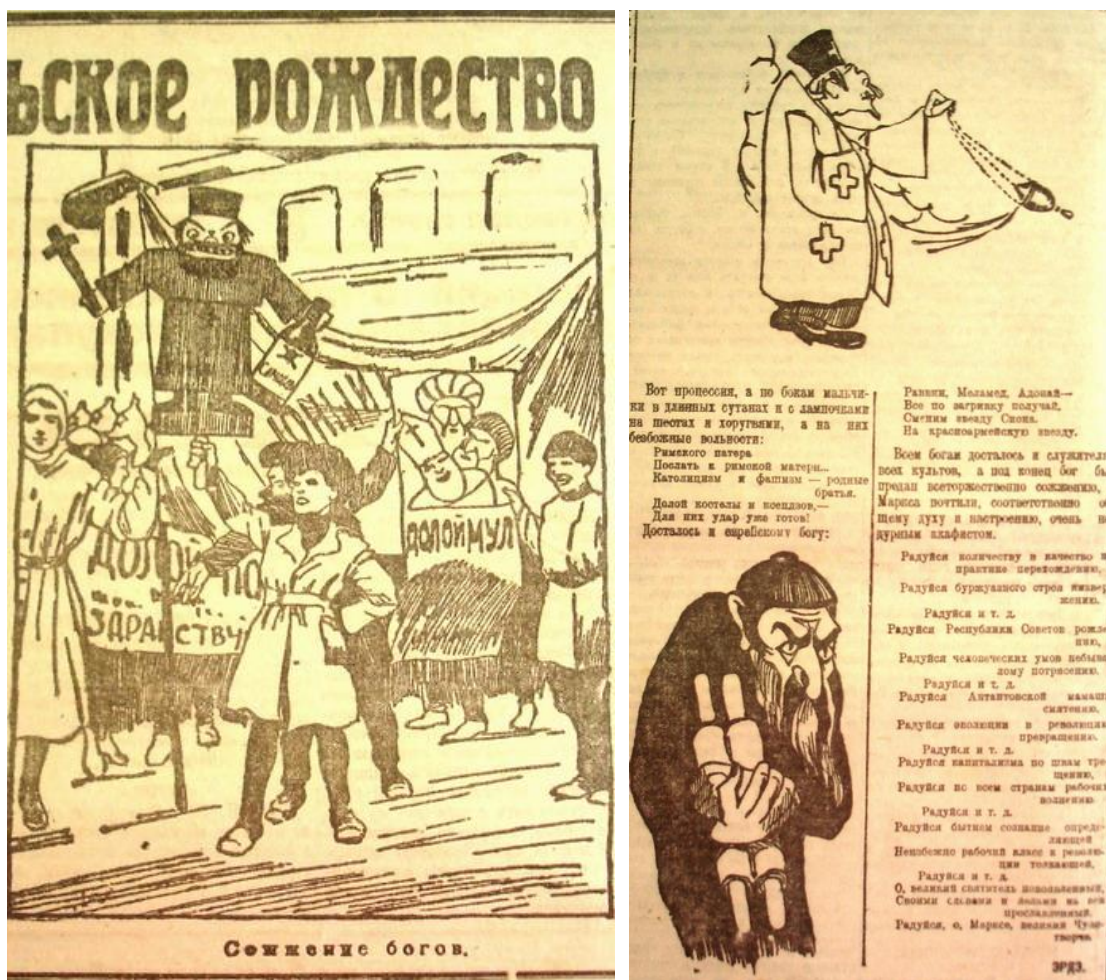
Рис. 5–6. Иллюстрации к статьям «Комсомольское рождество в Ростове» (Советский Юг. 14 января 1923 г.) и «Низложение богов» (Советский Юг. 24 января 1923 г.)