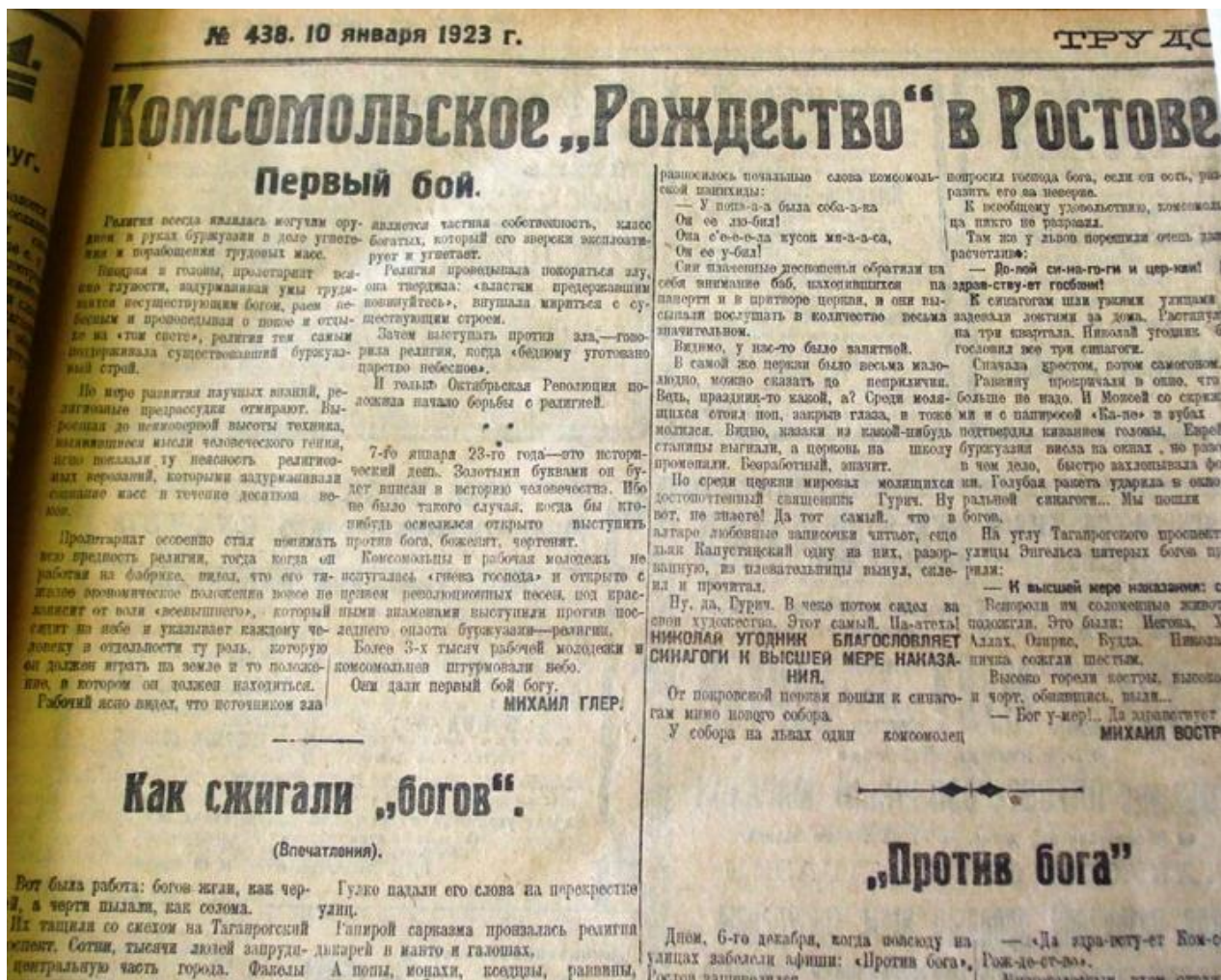
Рис. 4. Комсомольское «Рождество» в Ростове. Трудовой Дон. 10 января 1923 г.

В этот день // Трудовой Дон. 1923. 10 января. С. 3.