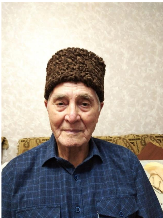
Рис. 1. З. Асанов.

В публикуемый текст внесена незначительная литературная правка, он приведен в соответствие с современными правилами орфографии и пунктуации. Сокращения или пропуск слов автором восстановлены публикатором и взяты в квадратные скобки.