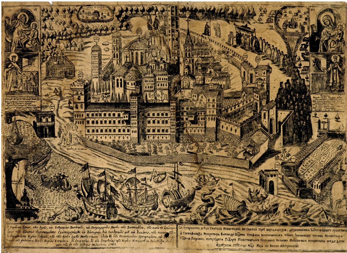
Рис. 1. Ватопедский Благовещенский монастырь на Святой горе Афон. Гравюра, Вена, 1761 г. Αρχεῖο τῆς ΙΜΜ Βατοπαδίου (Архив монастыря Ватопед. Шифр отсутствует).

В середине XVI в. из Галицкой Руси прибыл на Афон Иван Княгиницкий, который принял постриг в Ватопедском монастыре с именем Иезекииль. Его добродетель и слава о подвигах стала известна на всем Афоне. При нем ватопедские монахи дважды предприняли сборы пожертвований в Московском царстве, а о. Иезекииль их сопровождал в качестве переводчика. Первая поездка по сбору, состоявшаяся около 1597–1598 гг. во главе с игуменом Пахомием, увенчалась большим успехом: братия вернулась на Святую гору со многими дарами. Вторая поездка состоялась на несколько лет позже, но из-за начавшихся смут в России, ватопедские монахи не смогли достичь Москвы. При этом, монах Иезекииль промыслительно остался в Малой Руси: святогорца приглашали в различные монастыри для налаживания их уставов на афонский лад, в том числе – в Киево-Печерскую Лавру. Впоследствии старец принял великую схиму с именем Иов и основал скит в селе Манява (сегодня Ивано-Франковская область), который назвал «Новый Ватопед». В 1994 г. старец Иов (Княгиницкий) был причислен Украинской православной церковью к лику святых.