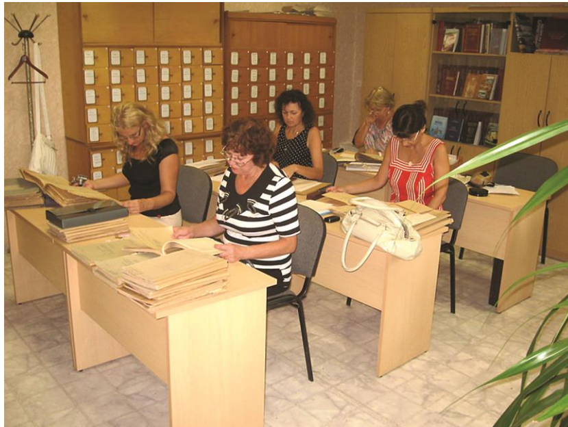
Рис. 2. Работа исследователей в читальном зале архива на проспекте Ленина.

Сложившийся коллектив в архиве всегда радушно принимает исследователей, оказывает им помощь в поисках материалов. Поэтому читальный зал архива никогда не пустует. В нем обязательно кто-то работает: исследователи, восстанавливающие историю предприятий и города, аспиранты, студенты, журналисты.