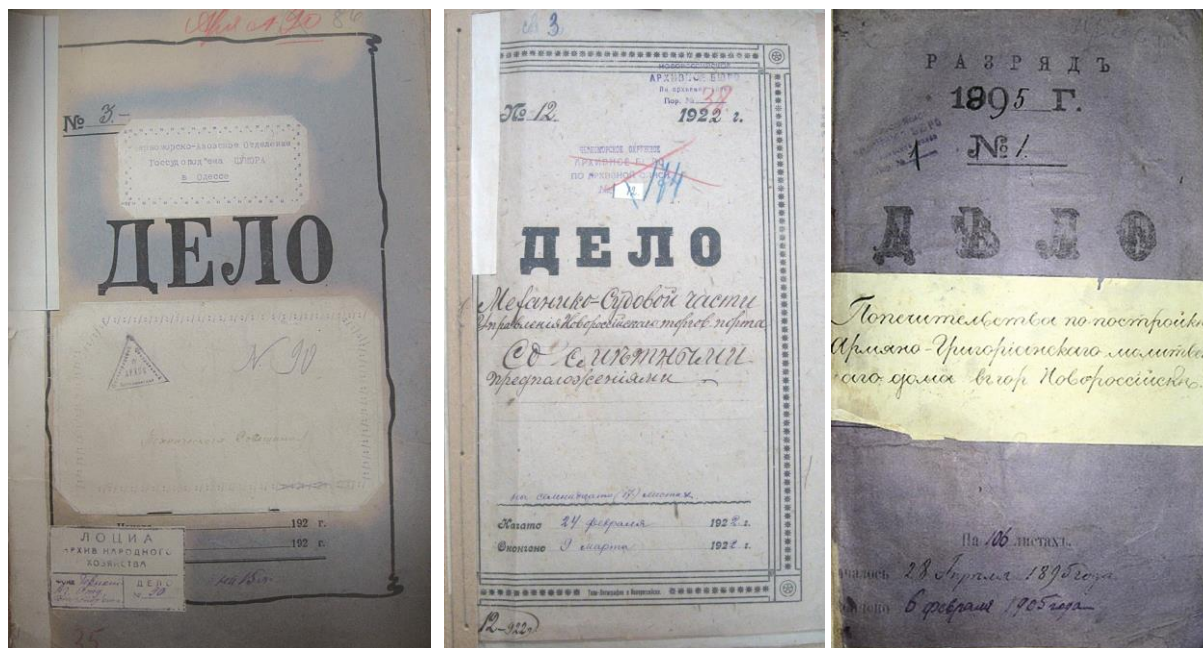
Рис. 3–5. Обложки архивных дел

Уникальным является фонд Р-26 «Городская комиссия по делам красных партизан». В нем содержится 1441 дело. В каждом из них – характеристики, воспоминания красных партизан, участников Гражданской войны и партизанского движения на Кубани и Черноморье, документы, рассказывающие о работе самой комиссии. Во многих случаях изложение своей версии событий их участниками отличается от общепринятой точки зрения. Но этот фонд досконально не изучался.