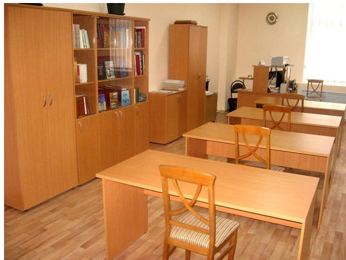
Рис. 8. Новый читальный зал