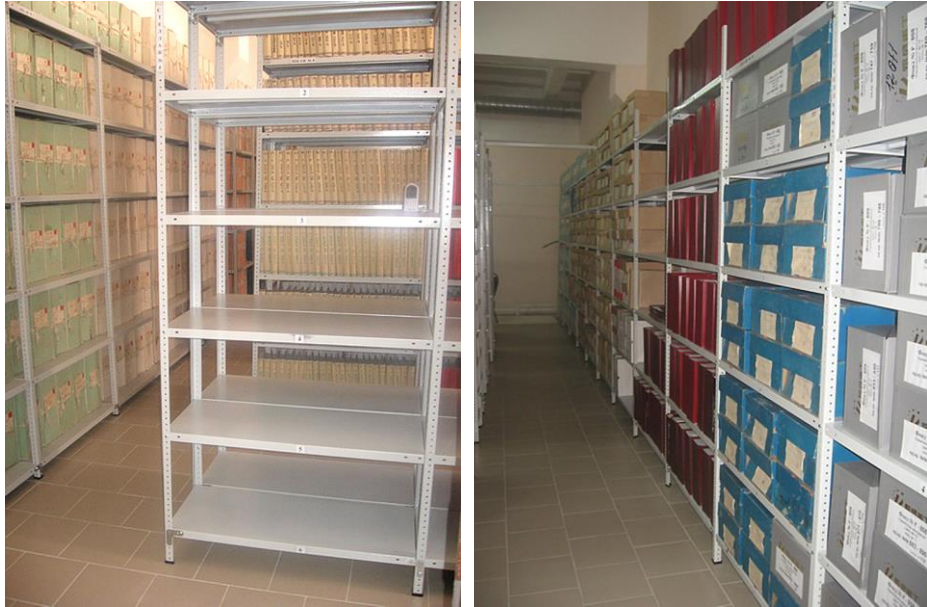
Рис. 6–7. Хранилища архива