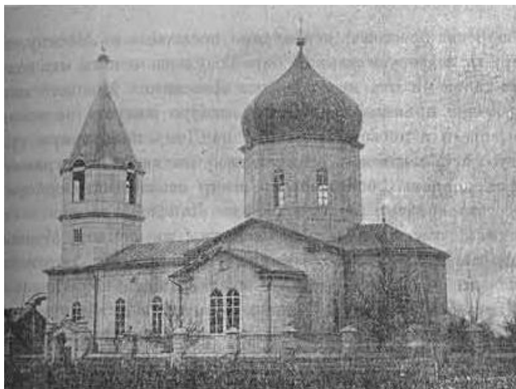
Рис. 1. Архангельская церковь станицы Романовской [20].

ГАРФ. Ф. Р-5263. Оп. 1. Д. 326. Л. 84–85 об. Копия. Рукопись