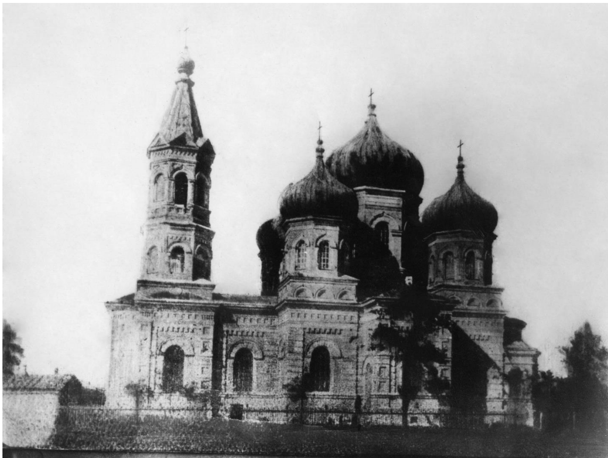
Рис. 3. Успенская церковь станицы Ольгинской