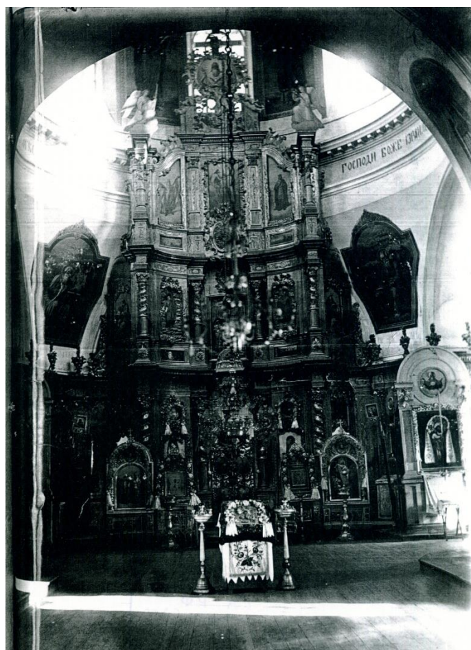
Рис. 6. Иконостас церкви Донской иконы Божией Матери станицы Раздорской [32].