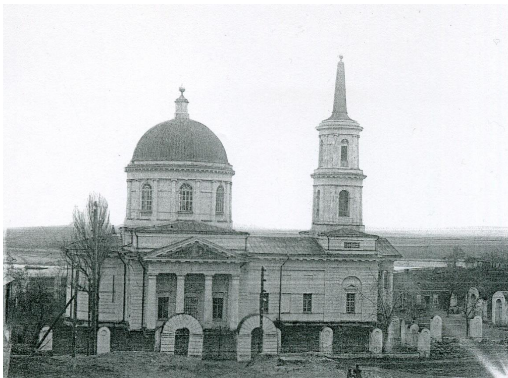
Рис. 5. Церковь Донской иконы Божией Матери станицы Раздорской [31].