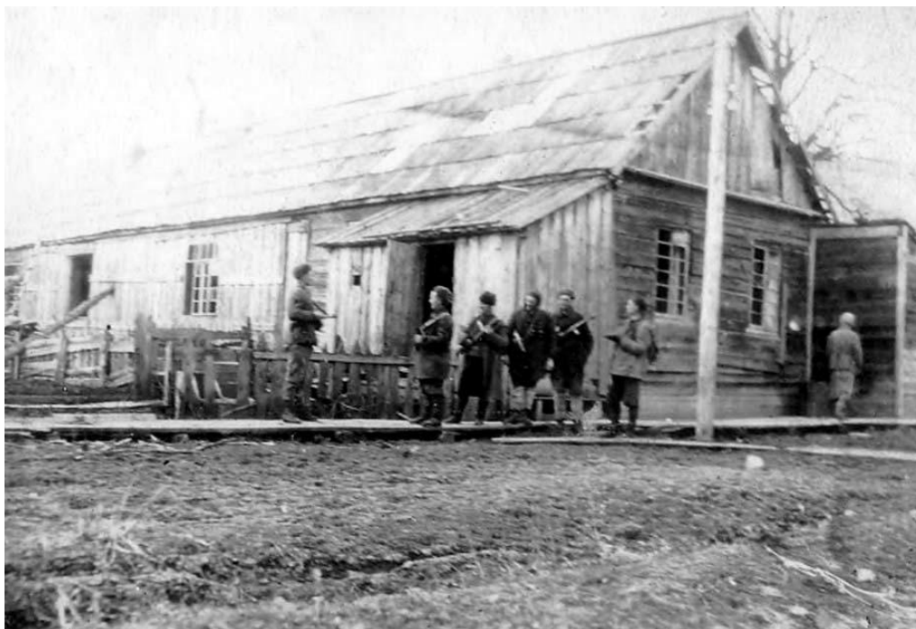
Рис. 3. Партизаны Апшеронского отряда в захваченном Конобозе.