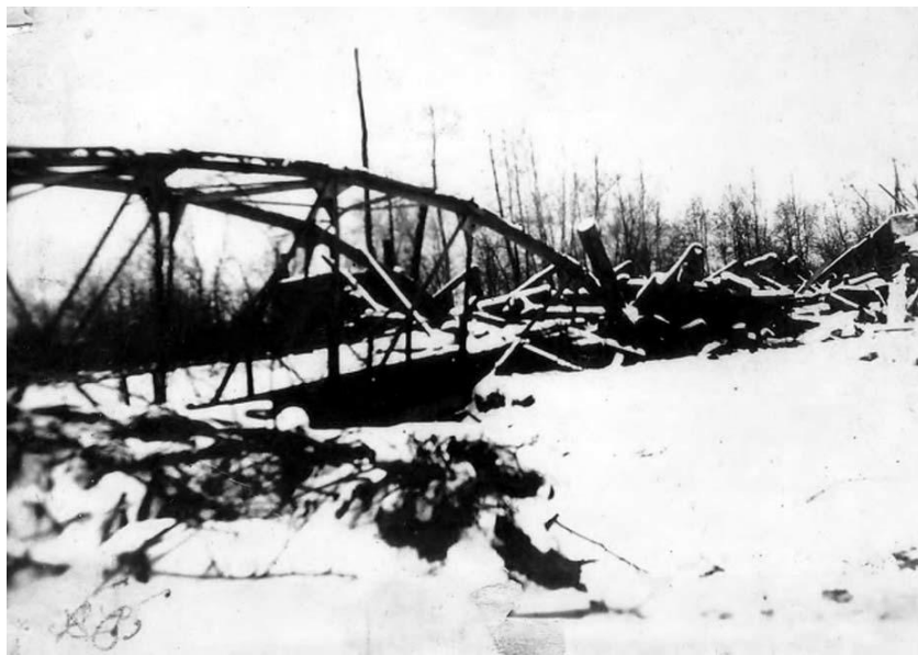
Рис. 5. Взорванный Чентарский мост на узкоколейной железной дороге. АИКМ

План всем понравился. И пришло время – начали его выполнять. Заняв исходные позиции, партизаны ждали, когда застрочит пулемет. И вот засвистели пули. В первый миг свалились в пропасть часовые, погас прожектор, и тут же пулемет хлестнул по двери и окнам караульного помещения. Тем временем Закопайко и Жильцов уложили под сваи тол и, прижимаясь к скалистому берегу, скрылись в темноте. Операция прошла удачно – Чентарский мост вторично взлетел на воздух.