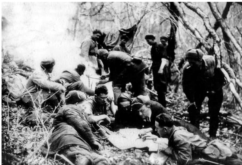
Рис. 2. Разработка плана операции руководством Апшеронского партизанского отряда им. Н.Ф. Гастелло.