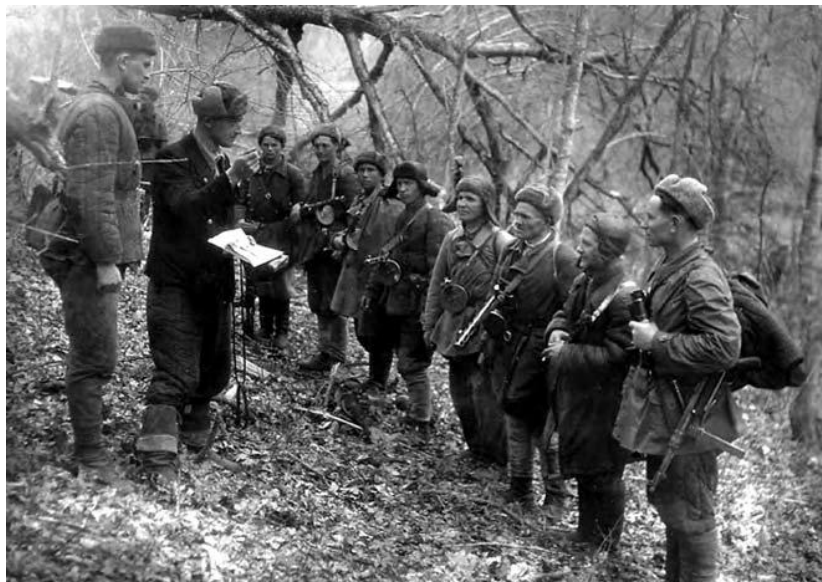
Рис. 4. Инструктаж руководителей АПО перед операцией. АИКМ

ЦДНИКК. Ф. Р-1774. Оп. 2. Д. 1354. Б/д. Л. 1–14