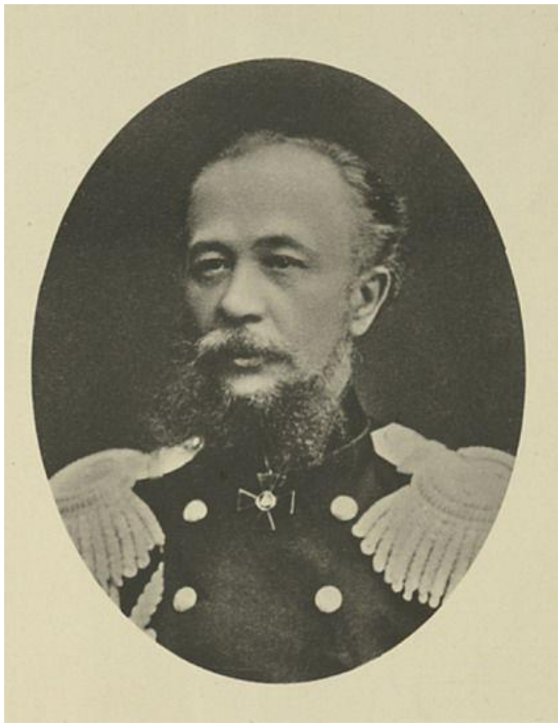
Рис. 1. Н.И. Краснов [15]

При публикации мы исправляли только очевидные описки Н.И. Краснова, оставив ошибки в пунктуации и вычислениях. Исправление последних потребовало бы системного пересчета выводимых донским статистиком цифр, а по пунктуационным ошибкам можно судить о его внимательности при работе над различными частями текста. Кроме того, мы позволили себе изменить графику и порядок следования некоторых таблиц, чтобы привести их к унифицированному виду (Н.И. Краснов был не слишком аккуратен в данном вопросе, что затрудняет поиск данных в первоисточнике).