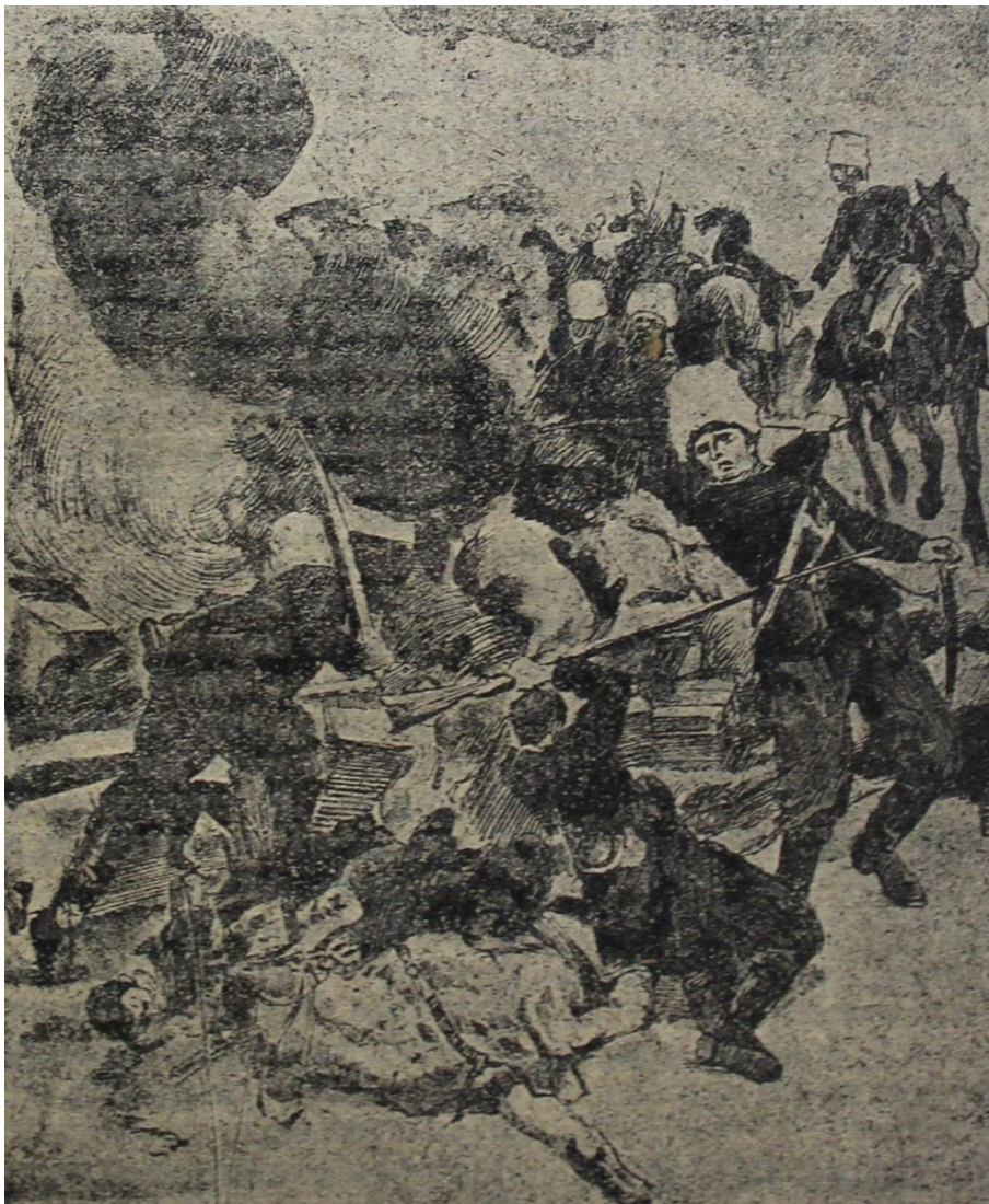
Рис. 4. На Кавказском фронте. Налет кубанских казаков на турецкий пикет (Листок войны (Ростов), 1916, № 41, с. 1)

Ранние тексты описывают чудеса героизма и самоотверженности, стойкость, волю к победе, непримиримость к врагу. С середины 1915 г. подобные публикации приобрели менее пафосный характер, в них стало больше натурализма и реализма. Это было следствием неудач на фронте, а также усталости общества от войны, позиционный и затяжной характер которой становился все более и более очевидным. В 1916 г. эта тенденция усилилась еще больше. В газетах стало меньше героики. Отклики на войну стали сводиться к сухим сообщениям «телеграмм» и фронтовых сводок. Лишь изредка они разбавлялись победными событиями вроде Брусиловского прорыва.