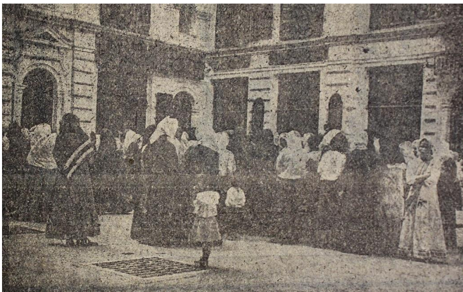
Рис. 3. Во дворе городской управы. В ожидании выдачи пособий (Листок войны (Ростов), 1916, № 42, с. 2)

Отдельное место в периодике военного времени занимала тыловая жизнь воюющей страны. Много внимания газеты уделяли дороговизне, дефициту, неустроенности быта, связанному с войной. В Ростовском-на-Дону «Листке войны» была опубликована достаточно необычная для этого периода статья «Бухарест или Ростов?». В ней рассказывается о том, что румынская элита, пользуясь преимуществами нейтралитета страны, вела разгульную и аморальную жизнь, что возмущало граждан воюющих стран. Но автор статьи указывал, что то же самое наблюдалось и в находившемся в тылу Ростове. Все «безобразия» совершались богатыми ростовчанами открыто и ни у кого не вызывали протеста. В 1915 г. российская публика уже отошла от шока, вызванного началом войны, а изначальный патриотический порыв иссяк. В регионах, далеких от театра боевых действий, жизнь возвращалась в нормальное русло. Сказывалась и усталость от войны, затяжной характер которой становился все более очевидным. Трудности военного времени затронули в большей степени бедные слои населения, а разрыв с «буржуазией» стал еще более глубоким. Несмотря на военную цензуру, критические тексты, подобные приводимому, стали все чаще появляться в газетах. Интересно также, что по своему посылу статья похожа на известное стихотворение Владимира Маяковского «Вам», написанное также в 1915 г.