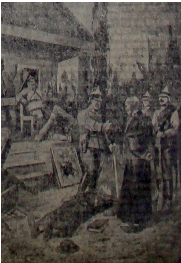
Рис. 2. В Польше. Для прусаков нет ничего святого ( Листок войны (Ростов), 1915, № 20, с. 1 )