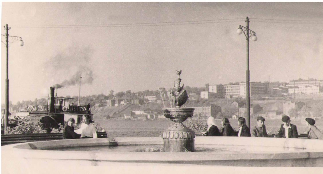
Рис. 2. Фонтан у паровой пристани. Фото Н.О. Бакалейникова (Селивановский, 2017: 225)

Однако изображенный на фотографии пароход – это не «Свобода», поскольку имеет слишком маленькие для нее размеры. Рубка практически равна ширине корпуса. На «Свободе» она зрительно меньше. А поскольку к указанному периоду на Ижевском пруду находилось лишь два парохода «Свобода» и «Звезда», получается, что С.Н. Селивановский опубликовал уникальное фото парохода «Звезда». Из этого можно сделать вывод, что пароход на фото Е.Н. Серебрякова (Рисунок 1), напротив, не «Звезда», а «Свобода» (рубка значительно уже палубы).