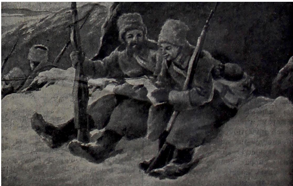
Рис. 1. Газета в окопах (Листок войны 1 , 1914, № 120)