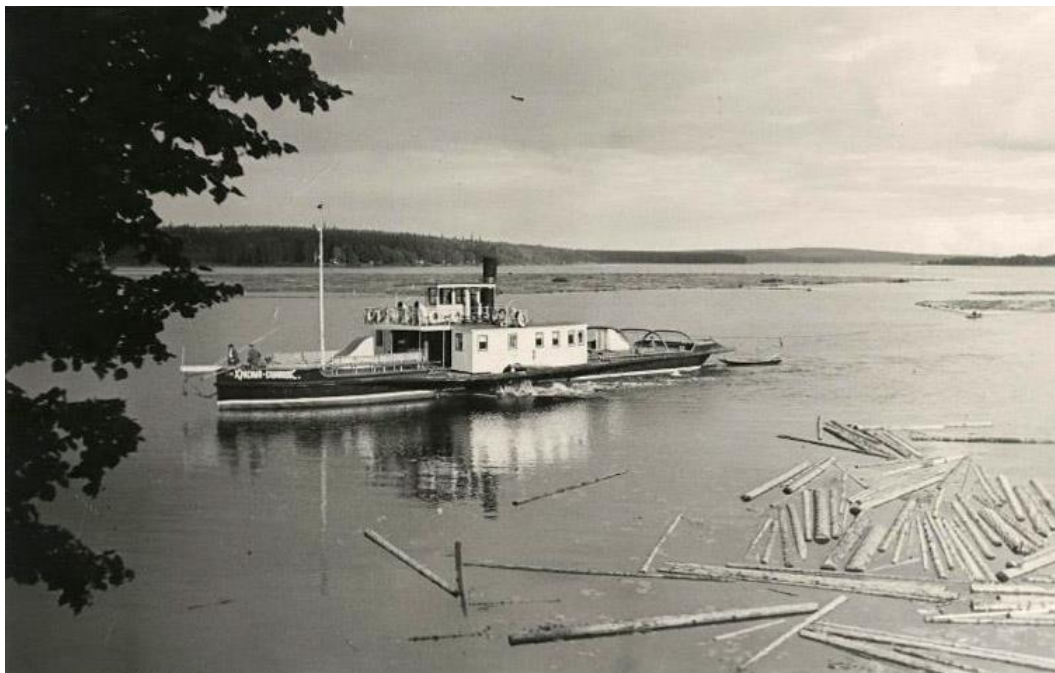
Рис. 6. Пароход. Начало 1960-х гг.

Среди фотографий Л. Стерховой, сделанных в 70-е гг. есть одна, на которой изображена деревянная пристань на Воложке Ижевского пруда ( Рисунок 7 ). На переднем плане стоят две девочки (одна из них – владелица снимка), а на заднем плане – катер, на борту которого написано «Отважный». Запечатленный катер не походит ни на один катер из состава Ижевской пристани, это название в имеющихся документах также не встречается. Слева у среза снимка имеются выступающие конструкции, которые можно идентифицировать, как рубку. Сама рубка в кадр не попала. Документация Сарапульского порта дает упоминание лишь об одном катере с наименованием «Отважный», но это буксирный катер. В данном же случае пассажирский салон это явно опровергает.