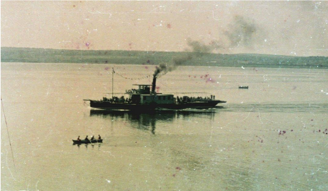
Рис. 3. Ижевский пруд. Цветная фотография 1953 г. (кадрировано)