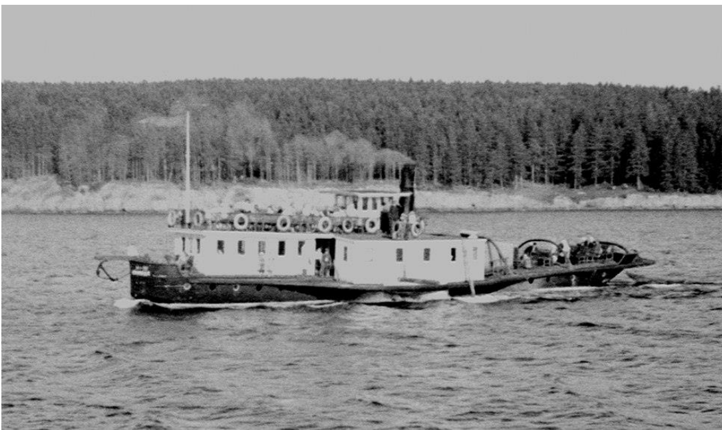
Рис. 4. Берег Ижевского пруда 1947 г. (кадрировано)

Первая фотография ( Рисунок 3 ) ранее уже анализировалась нами путем совмещения изображения на фотографии и чертежа парохода для Астраханского порта, строившегося Воткинским заводом, показавшего их полную идентичность ( Mitiukov et al., 2018b ). Но к фотографии можно применить также графические фильтры программы Adobe Photoshop, после чего на борту судна проступает надпись ( Рисунок 5 ).