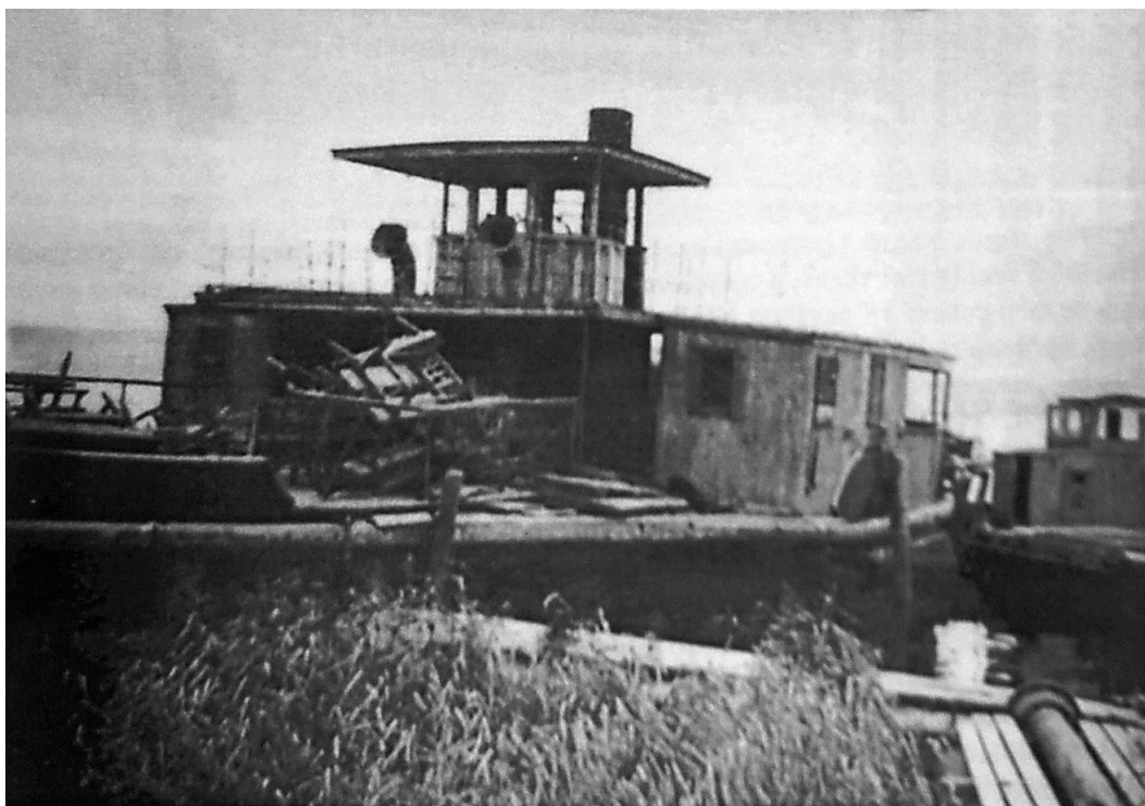
Рис. 2. Старая баржа на берегу Ижевского пруда, 1950-е гг.

В частной коллекции Владимира Мусиенко имеются фотографии, сделанные в 1947–1953 гг. его отцом Борисом Артемьевичем Мусиенко, в то время начальника бюро ремонта завода № 71 (ныне «Ижсталь»). Наибольший интерес из коллекции представляют фотографии, представленные на Рисунках 3 и 4 . На них изображены два самых крупных на то время парохода Ижевского пруда – «Красный сплавщик» ( Рисунок 3 ) и «Свобода» ( Рисунок 4 ). Видно, что пароходы существенно отличаются между собой и имеют разные пропорции надстроек.