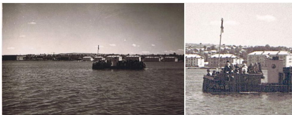
Рис. 9. Пассажирская баржа

В частной коллекции Ольги Ларионовой из Воткинска имеется несколько фотографий судов Воткинского пруда. Одна из них ( Рисунок 9 ) атрибутирована как «Пассажирская баржа» без указания даты.