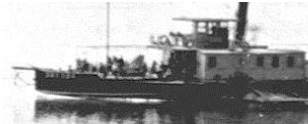
Рис. 5. Наложение на фотографию (рис. 3) графического фильтра

Надпись дублируется – в носовой части и на сиянии (кожухе гребного колеса с рисунком и (или) названием судна). К сожалению, четкость знаков не дает возможность однозначно их идентифицировать. Но видно, что в носовой части присутствует шесть символов, напоминающие какой-то цифровой код. Это мог бы быть регистровый номер парохода, но в 1950-е гг. он состоял из четырех цифр. Однако в 1953 г. в составе Ижевской эксплуатационной конторы появляется пароход «Звезда», в названии которого как раз шесть букв, очень похожих на надпись на Рисунке 5 . Буквы на сиянии читаются намного хуже, но, скорее всего, здесь тоже шесть букв, возможно с какими-то символами в начале и в конце слова. Эта находка очень важна для реконструкции судьбы ижевских пароходов, поскольку показывает, что с передачей «Красного сплащика» Ижевской эксплуатационной конторе он получил новое наименование «Звезда». До этого мы предполагали, что «Звездой» мог быть бывший пароход «Иж», после революции переименованный в «Красную звезду» ( Mitiukov et al., 2018a ). Информация об этом пароходе пропадает в середине 1930-х гг., и его однозначно нет в статистическом отчете судов Ижевского пруда на 1940 г. Поскольку имелись сведения, что на «Красном сплащике» в конце 1940-х гг. были проблемы в машинах, мы предположили, что в это период его списали. Но тогда становился совершенно непонятным перерыв в биографии «Красной звезды» с середины 1930-х по 1953 гг.