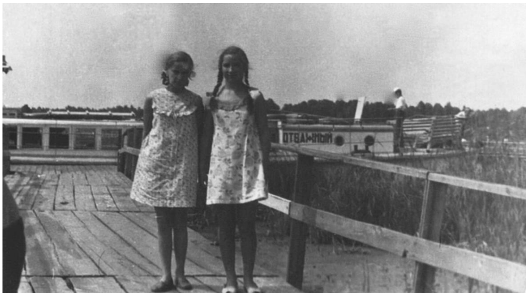
Рис. 7. Катер на Воложке 1970-е гг.