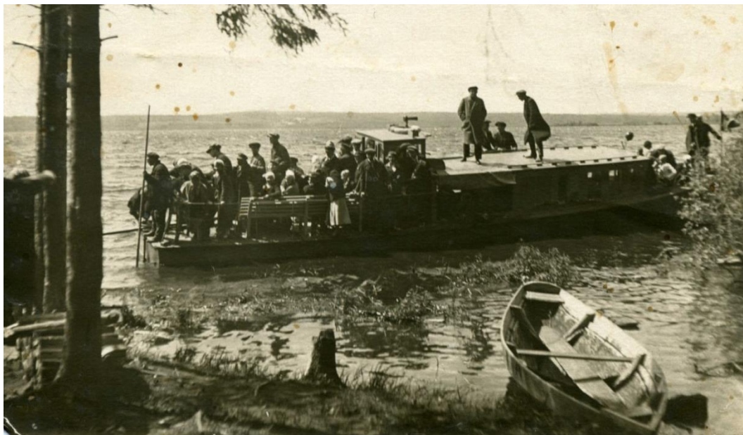
Рис. 1. Неизвестный катер у Соловьевской дачи