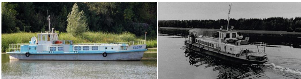
Рис. 8. Переделка серийных «Такелажниц» в пассажирский вариант слева катер «Кодор» ( http://fleetphoto.ru/photo/102679 ) и справа – катер «Школьник» ( http://fleetphoto.ru/photo/273554 )

Фотография из коллекции Ольги Ларионовой. В частной коллекции Ольги Ларионовой из Воткинска имеется несколько фотографий судов Воткинского пруда. Одна из них ( Рисунок 9 ) атрибутирована как «Пассажирская баржа» без указания даты.