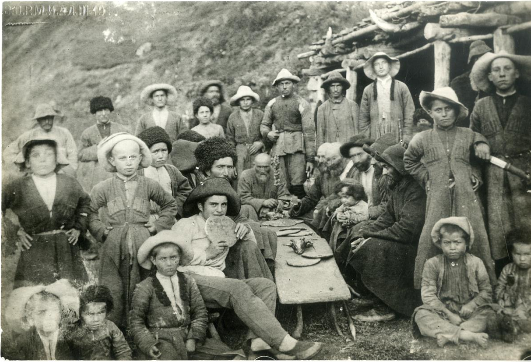
Рис. 1. Группа осетин-мужчин за трапезой. РЭМ. № 3376-1

Очень хочу приехать в Петербург, чтобы осмотреть собранные до сих пор коллекции. Это будет для меня не только приятно, но и полезно, так как [коллекции] дадут возможность лучше познакомиться с системой лучших собирателей. Не знаю, удастся ли?! Примите уверение в совершенном почтении.