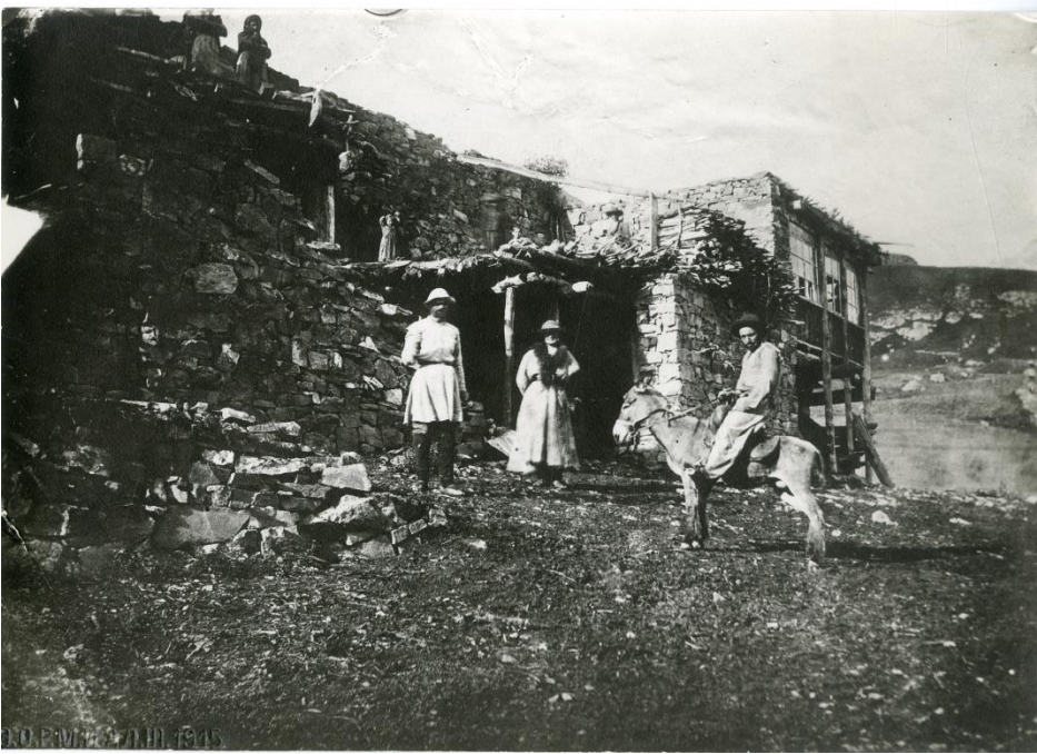
Рис. 3. Часть аула. Жилые постройки. РЭМ. № 3376-3