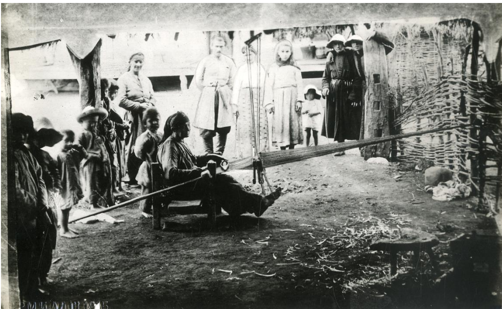
Рис. 2. Старуха за работой у ткацкого станка. РЭМ. № 3376-2

АРЭМ. Ф. 1. Оп. 2. Д. 53. Л. 32. Рукопись. Подлинник