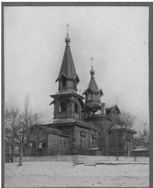
Рис. 2. Успенская единоверческая церковь г. Новочеркаска. 1935 г. (Чибисова, 2013: 180)